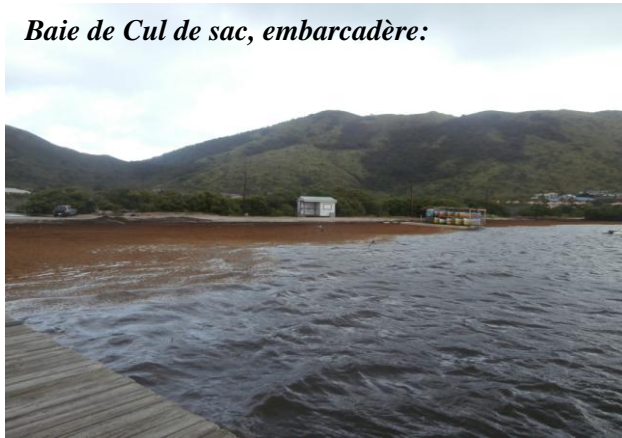
Baie de Cul de sac, embarcadère: